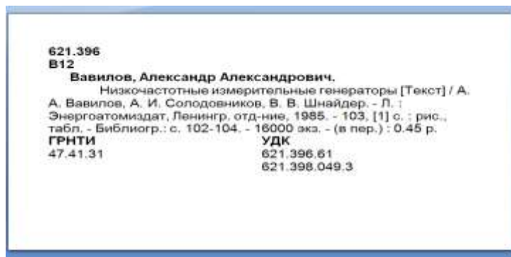
Основная каталожная карточка