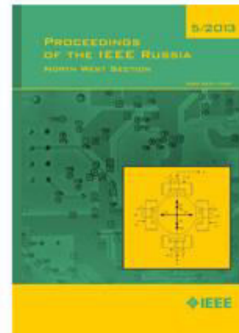
Proceedings of the IEEE Russia. North West Section