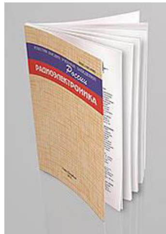
«Известия вузов России. Радио электроника»