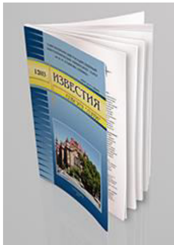
Известия СПбГЭТУ «ЛЭТИ»