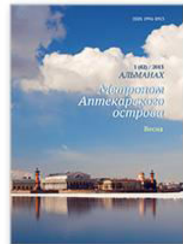
Альманах «Метроном Аптекарского о острова»